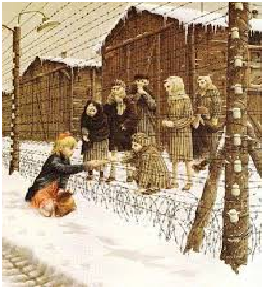
Dal libro "Rosa Bianca", di Roberto Innocenti

Alcune proposte di letture e di film dal catalogo della Biblioteca